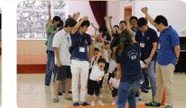
気合いのエイエイオー！