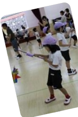
たくさん走るお散歩カー。上手く作れるかな？