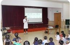
歯医者さんが来てくれました！

いつまでも健康な歯を保つために、歯医者さんをお招きし、“歯”について教えて頂きました。