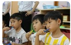
虫歯にならないようにしっかりみがこうね♪