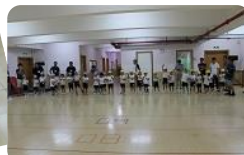
お父さん、いつもありがとう！大好き♡