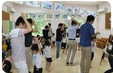
みんなでうさぎに変身！！

6月17日は父の日。幼稚園では父親参観がありました。この日は、大好きなお父さんやお母さんと一緒に体を動かしたり、製作をして楽しみました！