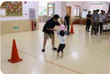
風船をお父さんと運んだり～