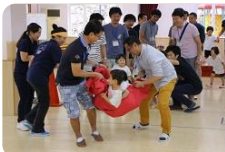
力持ちのお父さんに運んでもらったり～